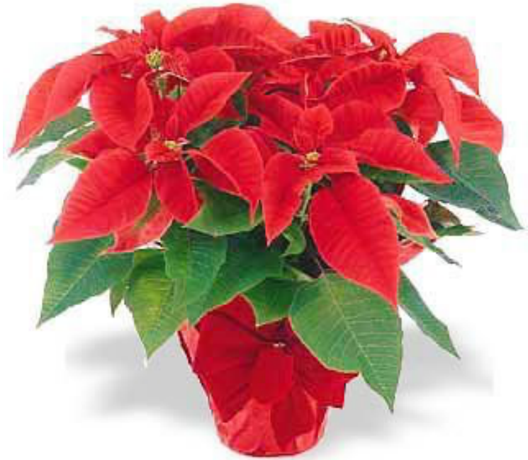
Euphorbia pulcherrima (Kerstster)

Voor het vormen van bloemknoppen 12 uur in het donker!