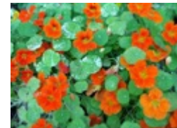
Oost indische kers